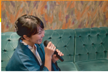
カラオケがうまくなりたい…