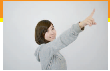
親切丁寧なAAFDでボイトレだ！