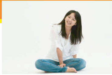
そんな時は気軽にレッスン！