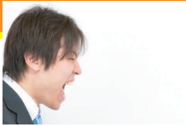
大きな声を出せるようになりたい…